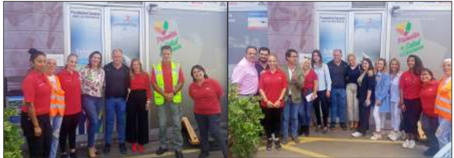
Grupo PP Cabildo de Tenerife